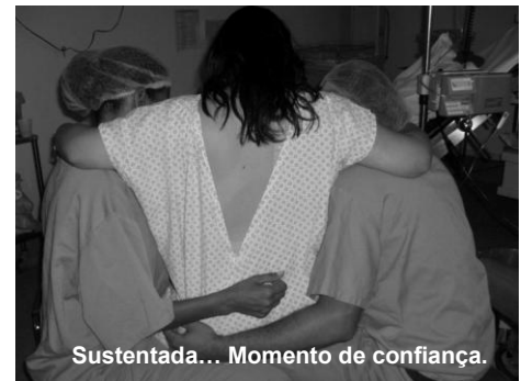
Sustentada... Momento de confiança.