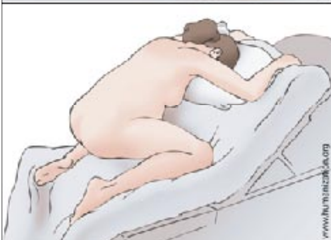
Figura 3 - Posição inglesa, mãos-jelho, de quatro ou de Gaskin.