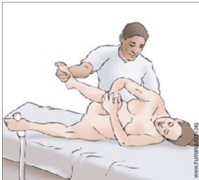
Figura 4 - Posição francesa, decúbito lateral esquerdo ou de Sims.

Estudos nas últimas décadas que comparam as diversas posturas adotadas durante o trabalho de parto e parto tem revelado que todas as outras posições (de pé, de cócoras, sentada ou DLE) são superiores à litotomia dorsal em relação à progressão do trabalho de parto e às vantagens fisiológicas para mãe e feto (Gupta & Nikodem, 2000; Lewis et al., 2004). A posição supina está associada a padrões anormais dos batimentos cardíofetais à cardiotocografia (Abitbol, 1985) e queda no pH da artéria umbilical e na saturação de oxigênio à oximetria de pulso (Carbonne et al., 1996). Por isso, essa posição deve ser desencorajada e reservada somente para os partos vaginais operatórios.